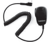
TurboSky TK-8 Тангента с поворотным креплением

Информацию о том где приобрести гарнитуры и другие аксессуары для радиостанций вы можете уточнить на официальном сайте: