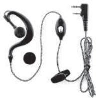
TurboSky TK-1 KV Гарнитура с заушной кевларовой обёрткой провода