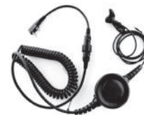
TurboSky TK-7 Ушной ларингофон с большой кнопкой PTT