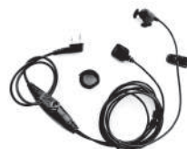
TurboSky TK-6 Ушной ларингофон с выносной кнопкой PTT на палец