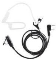
TurboSky TK-2 Гарнитура скрытого ношения с прозрачным звукководом