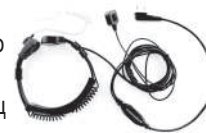
TurboSky TK-5 Ларингофон скрытого ношения с выносной кнопкой PTT на палец и регулировкой ширины