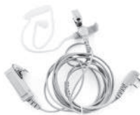
TurboSky TK-3 White Гарнитура скрытого ношения с прозрачным звукководом