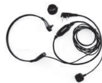
TurboSky TK-4 Ларингофон скрытого ношения с выносной кнопкой PTT на палец