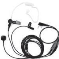
TurboSky TK-3F Гарнитура скрытого ношения с выносной кнопкой PTT на палец