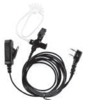
TurboSky TK-3 Black Гарнитура скрытого ношения с прозрачным звукководом