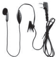
TurboSky TK-1 Гарнитура однопроводная

Данные гарнитуры предназначены как для любителей, так и для профессионалов.